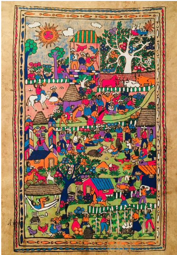
Museum of International Folk Art Education Collection, photo by Patricia Sigala.

The State of Puebla to the east of Mexico City is known for their amate paper production and the artisans in the small town San Pablito, who are of Otomí ancestry, produce cut-out figures called Nahuales (devils and spirits) used in ceremonies. To the southwest in the State of Guerrero, amate paper is brightly decorated with beautiful scenes depicting everyday life of the villagers, such as the harvest, fiestas, weddings, religious customs and wildlife.